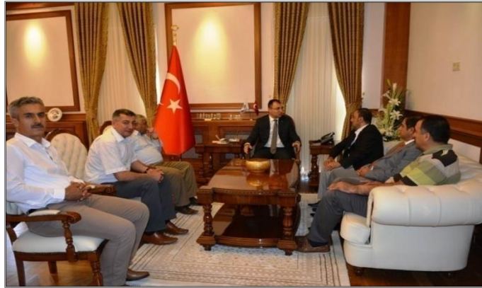
Borsamızdan Yeni Malatya Valisi Mustafa Toprak'a Ziyaret

10-11 Mayıs 2016 tarihleri arasında Ankara'da yapılan Türkiye Odalar ve Borsalar Birliğinin 72. Genel Kurul Toplantısına Malatya Ticaret Borsası olarak geniş bir katılımı ile iştirak edildi